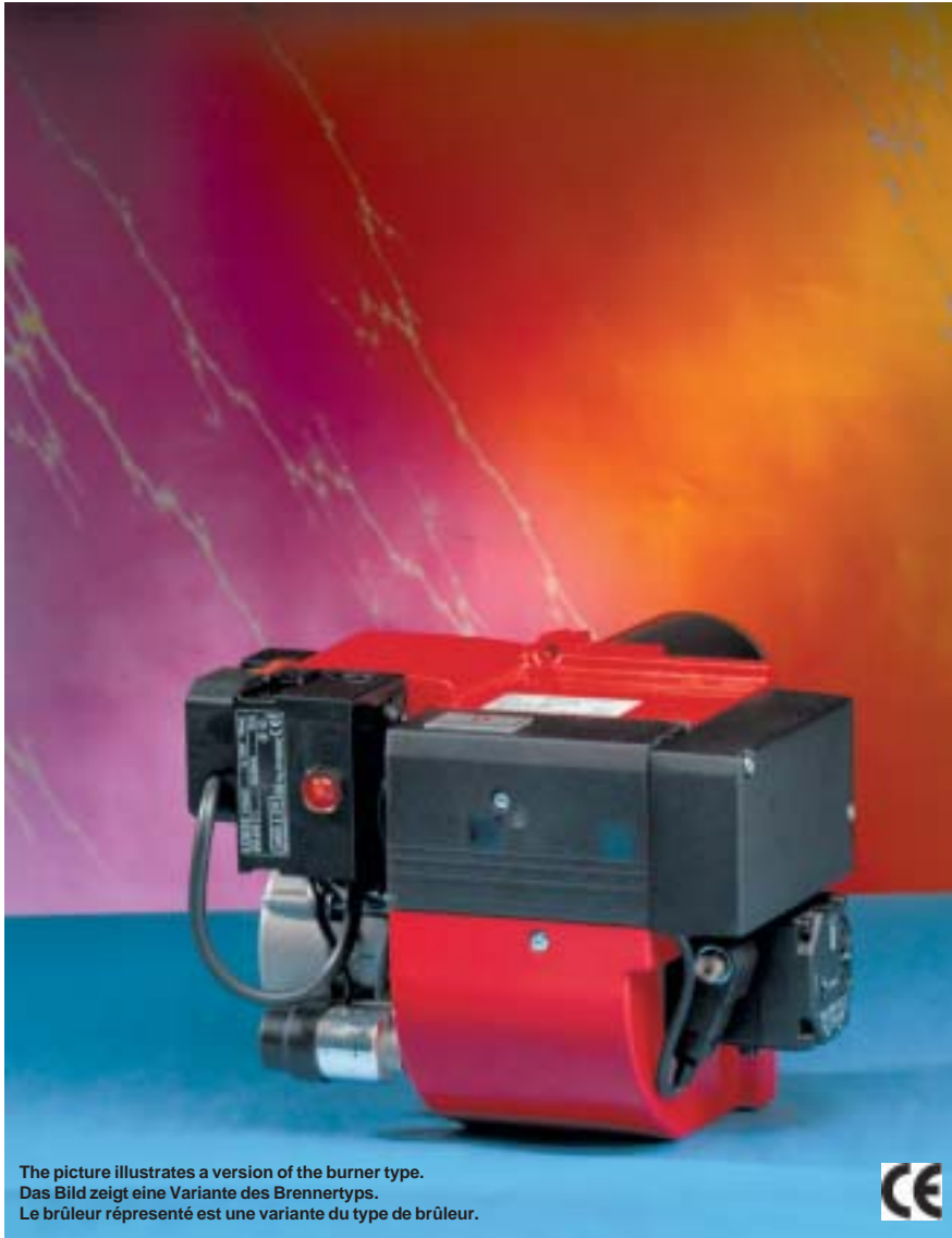
The picture illustrates a version of the burner type. Das Bild zeigt eine Variante des Brennertyps. Le brûleur représenté est une variante du type de brûleur.